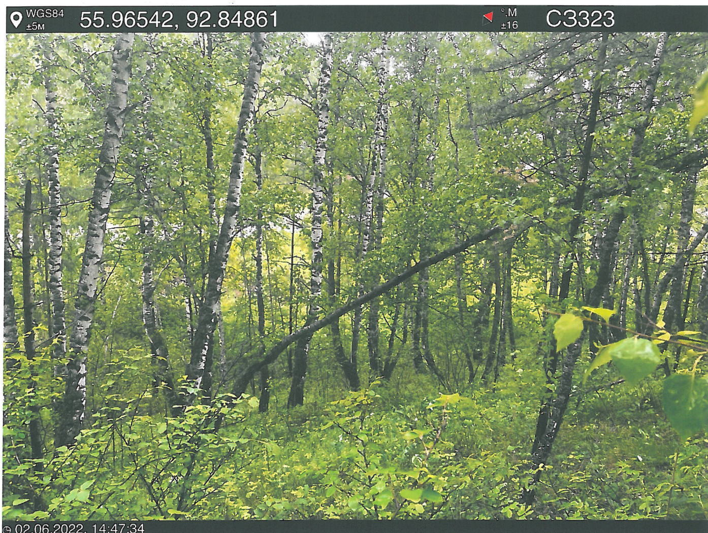
Фото – отчет о выполнении работ по проведении лесопатологического обследования в 2022 году. Лесных насаждений Городского лесничества г. Красноярск, Красноярский край(субъект РФ) Базайское участковое лесничество Квартал 12 выдел 11, площадь выдела 1,0 га.

Исполнитель работ по проведению лесопатологического обследования: